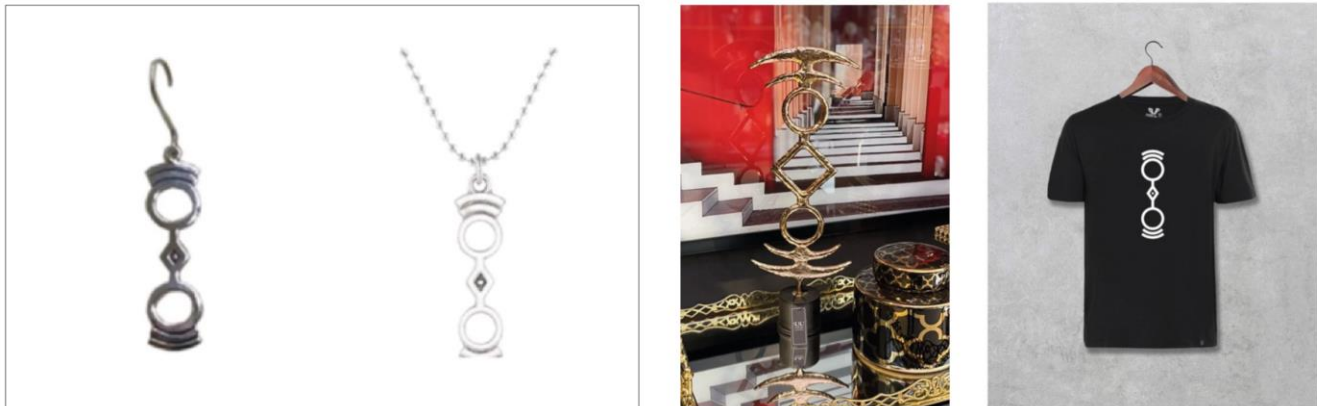
Şekil 3. Atiye Endüstriyel Ürünler, (URL 3, 2023)