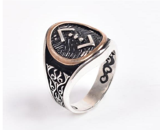
Şekil 4. Çukur Simgeli Yüzük, (URL 4, 2023)