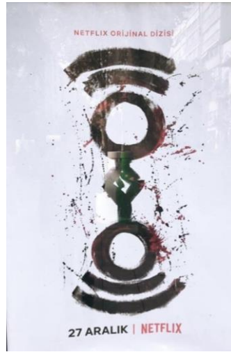
Şekil 2. Atiye (The Gift) Dizisinin Tanıtım Afişi, (URL 2, 2023)